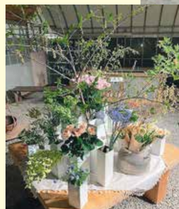
季節感溢れるアレンジメント