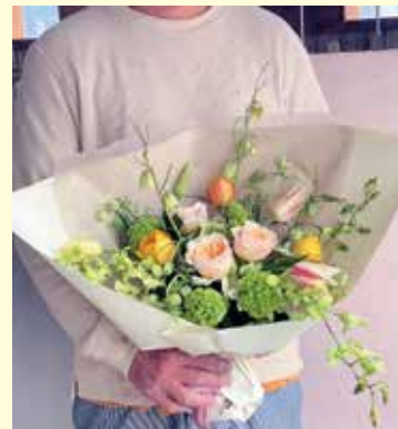
母の日のフラワーギフト

【営業日】 毎週金、土曜日 10時～17時 各種フラワーギフト受付中!! （ギフトのご予約は営業日以外も承っております。）