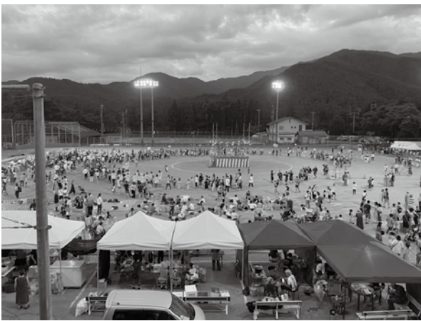
第35回 お夏まつりの様子