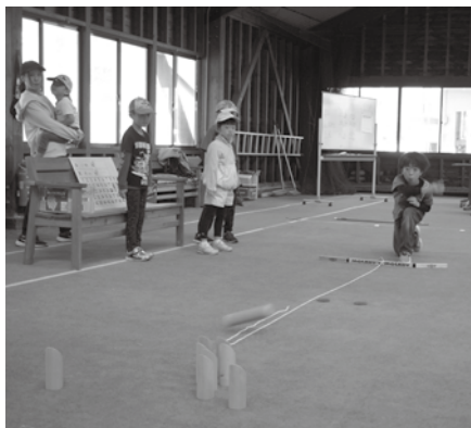
第74回 朝日村体育祭モルック体験の様子