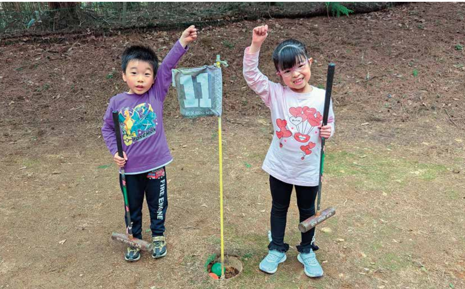
《カップインしてポーズ!》