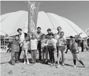
ゴール後の小学生チーム

大会当日はとも気持ちのよい天気の中、皆さんの健闘で一般の部は51チーム中33位、小学生の部は58チーム中58位という結果でした。選手団、関係者の皆様お疲れ様でした。