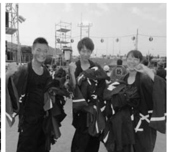
信大サークル和っしょいの皆さん