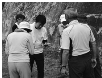
⑫駐車場にて記念品を頂く 15:12

【参加者の感想】 ◆伊那市の女性 登山道が歩きやすくて大変良かった。 ◆松本市の男性 地元の山へはよく登るが、鉢盛山は初めてで、登りやすい山でした。