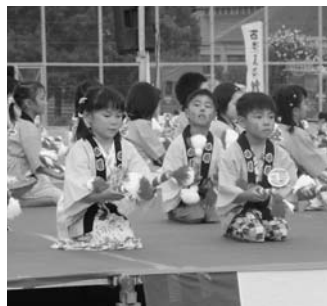
がんばってる銭太鼓