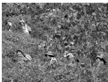
⑦最後の登り あと少し 11:27