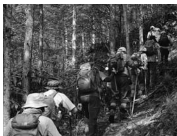
③カラマツ林を登る 9:07