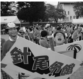
もう仕上がってます