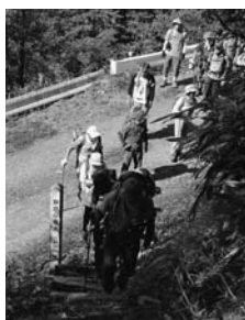
②登山道入口 さあ出発 8:38