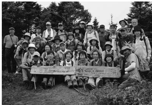
⑨山頂にて記念撮影 12:42