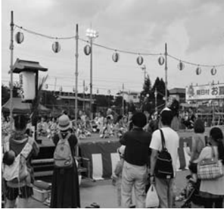
親御さんも緊張です