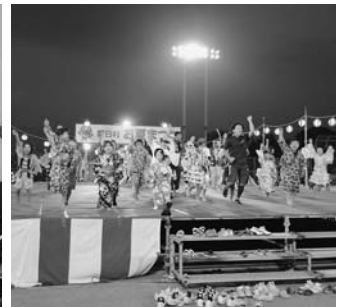
信濃の国踊りイェー