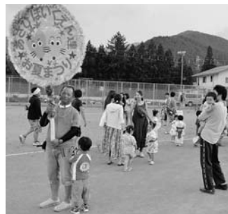
みんな頑張りうね