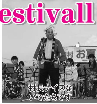
村長ナイスな いでたちです