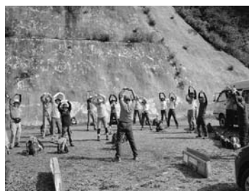
①駐車場で準備体操 8:29