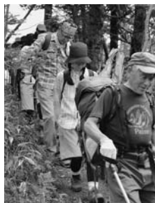
⑪昼食を済まし 下山へ 12:46