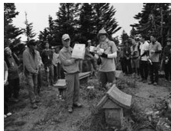
⑩木祖村との記念品交換 11:45