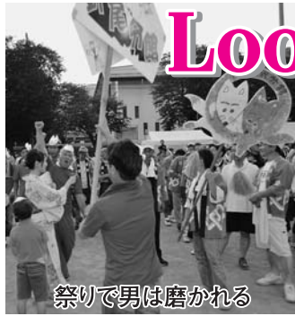
祭りで男は磨かれる