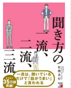
「聞き方の一流、二流、三流」 著者：松橋良紀 出版社：明日香出版社

「あなたにまた会いたい」と言われたい人に 気まずい沈黙が流れたとき 三流は、沈黙に耐えられず、 二流は、ソワソワし、 一流は、べつすねっ。 一流の聞き方、二流の聞き方、 一流の聞き方の3つを比較しながら心理学に基づいた、とっておきの聞き方を紹介しています。