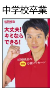
中学校卒業 「大丈夫！キミならできる！」 著：松岡修造 出版：河出書房新社

卒園・卒業を経て1つおとなになるみなさんへおくる1冊です。 明るく前向きな気持ちで将来に思いをはせてください。 卒業おめでとう！