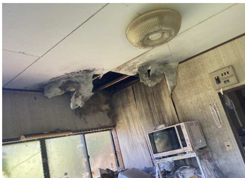
老朽化が進行し、天井が崩れた部分