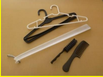
ハンガー、くし、ヘアブラシ、靴べら(小さく切断すること)