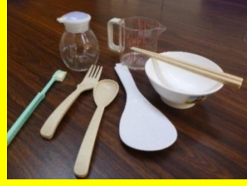
食器、しゃもじ、醤油さし、計量カップ、歯ブラシ