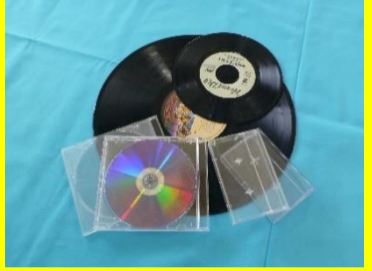
CD、CDケース、レコード、カセットテープケース