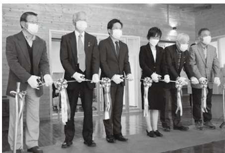
オープンテープカット