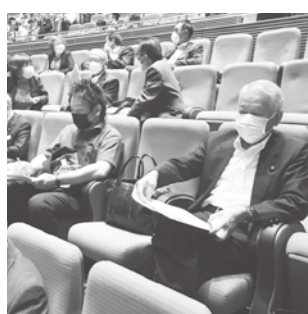
議長・副議長が参加

去る5月30日(月)に東京国際フォーラムにて全国町村議長・副議長研修会が開催されました。