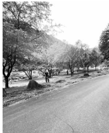
中俣沢せせらぎ公園