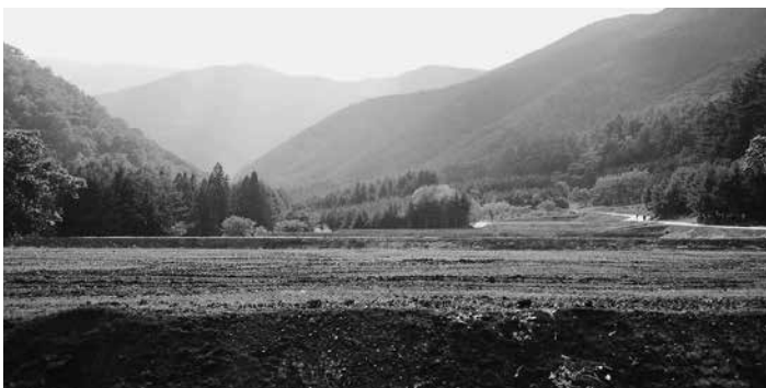
6月に竣工した御馬越工区ほ場整備