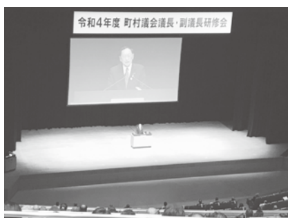
会場となった東京国際フォーラム

当村では議長・副議長の2名で出席をし、全国から総勢1600名の町村議長・副議長が参加いたしました。研修内容は「町村議会のあるべき姿・町村議会の報酬について」・「地方議会とハラスメント」の講義を受講。昨今の地方議会をめぐる動向については、多くの議会の共通認識として議員のなり手不足が顕著であり、特に若手議員や女性議員が少なく、議会機能が活性化していない。結果、地方政治の衰退・なり手不足の広がりが、投票率の低下へとつながっていく。議員が少なければ