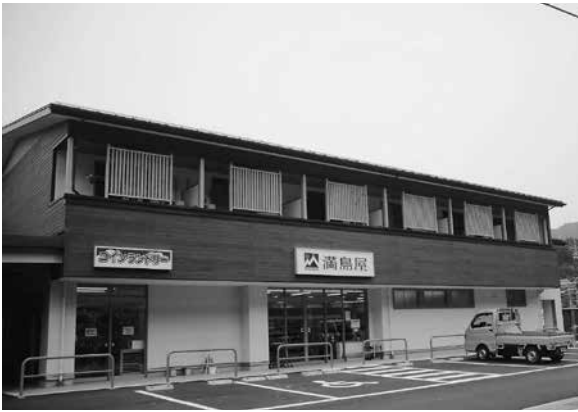
天龍村設スーパー「満島屋」

産業振興課長 4月に確認したのは対処している。赤松があるのは確認して心配のない分今後伐倒を予定、すでに34本は伐倒している。予算は2千数百万ですが早期発見早期駆除で対応したい。