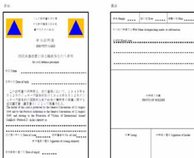
（身分証明書のひな型）