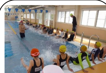
波田B&G海洋センターでの水泳学習 インストラクターに教わっています。