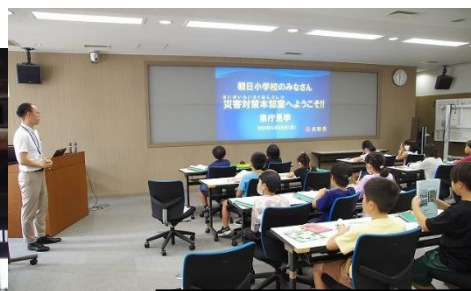
県庁では、県議会の傍聴や、 災害対策本部室で防災の学習