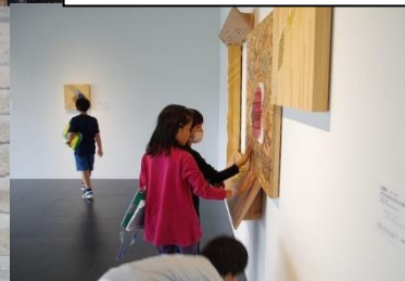
県立美術館では「触る作品」も体験

事前にたくさん学習して行きましたが、実際に見たり聞いたりするとわかることがたくさんありました。県庁10階でのランチや善光寺お戒壇巡りなど、楽しみながら学んだ1日でした。